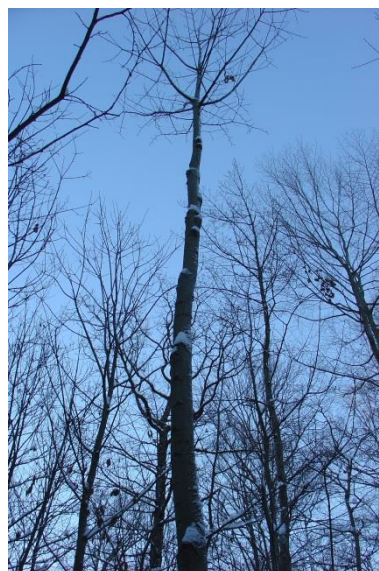
Arbre de place N° 5 avec un axe traversant.