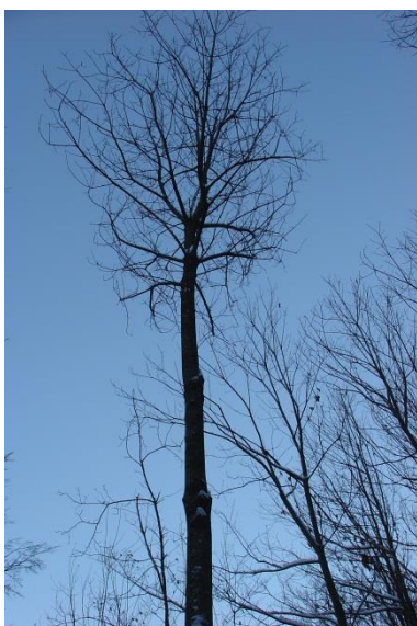
Arbre de place N° 8 avec une couronne symétrique et très équilibrée.