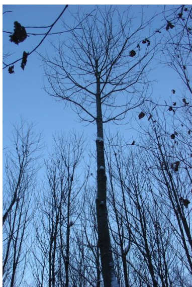
Arbre de place N° 6 qui est le plus fort du point de vue de l'accroissement en diamètre (voir table). En plus il a aussi un houppier large.