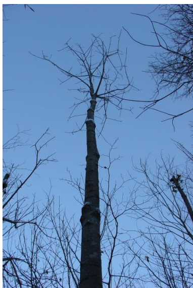
Arbre de place N° 2 avec la tige légèrement courbe.