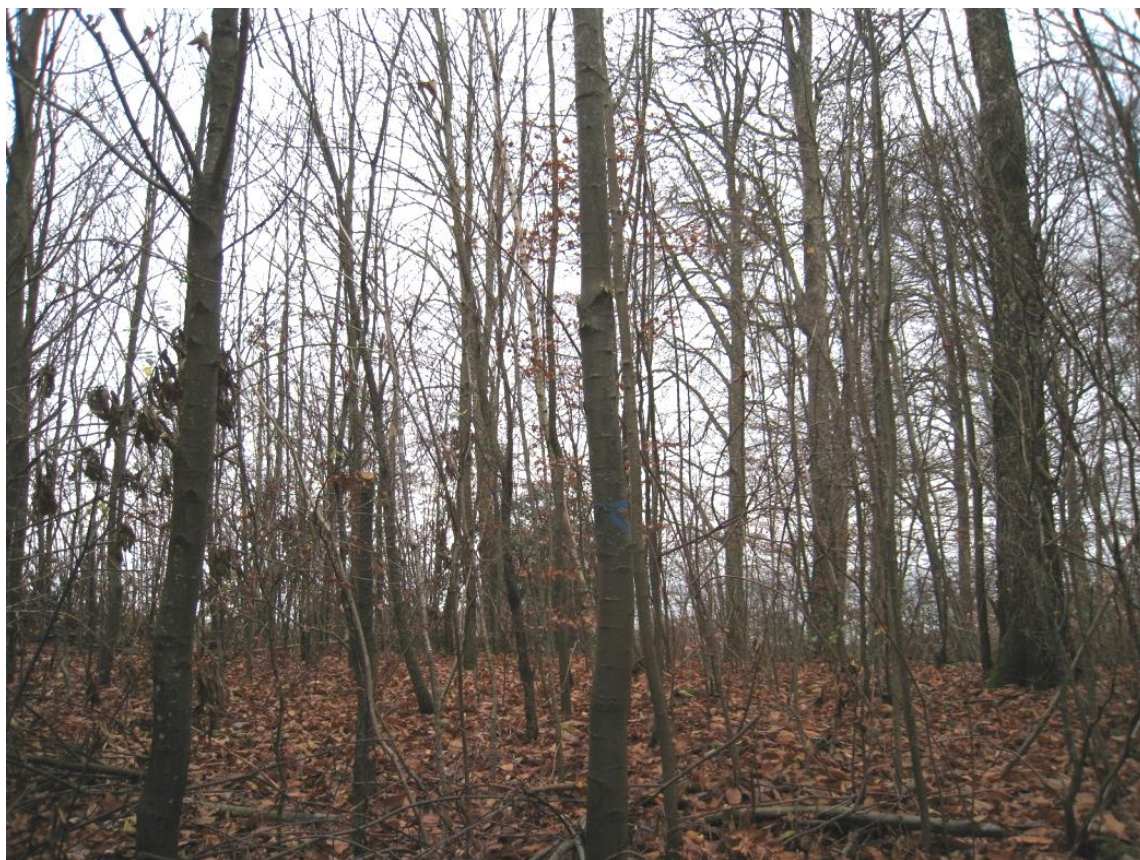
Peuplement photographié le 17 novembre 2010 . Au premier plan arbre de place No 2.