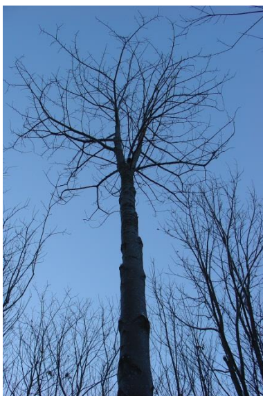
Arbre de place N° 3 avec une fourche à 7 m. À part cela avec une très belle tige.