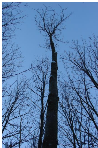
Arbre de place N° 9 qui est légèrement courbe avec une couronne assez courte et moins volumineuse.